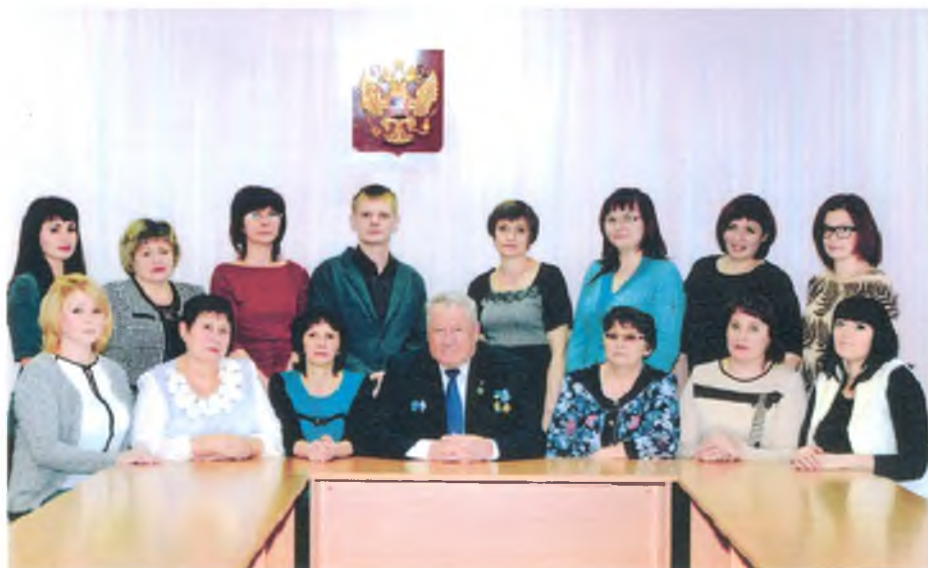
Коллектив Администрации и АХС гп Луговой в здании по ул. Пушкина, 7. Январь 2015 г.