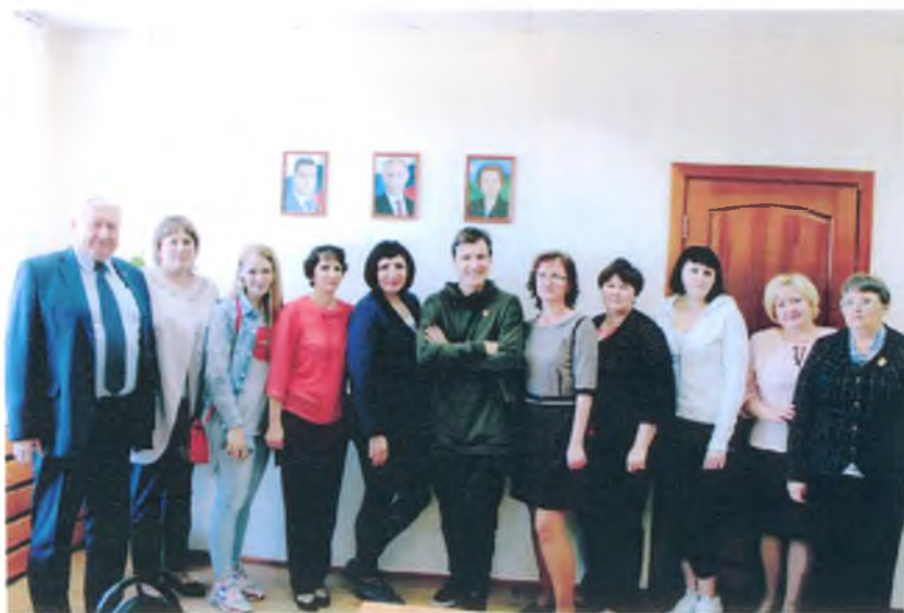
Коллектив Администрации гп Луговой с земляком из шоу «Уральские пельмени» Мясниковым Вячеславом Владимировичем. 2017 г.