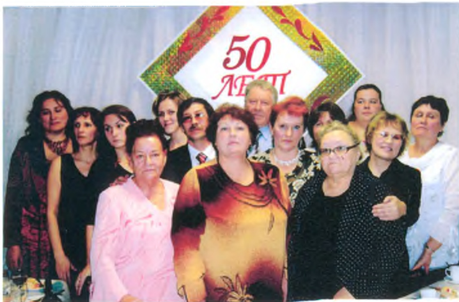
Коллектив коллег Луговского пос. Совета разных лет на юбилейной встрече, посвящённой 50-летию Луговского сельского Совета. 14 ноября 2007 г.