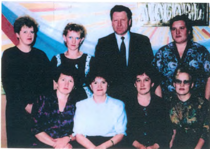
Коллектив Администрации гп Луговой 1995 год