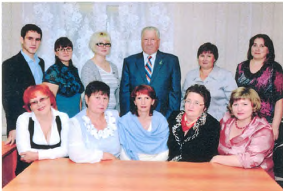
Коллектив Администрации гп Луговой в здании по ул. Ленина, 22. 2013 год