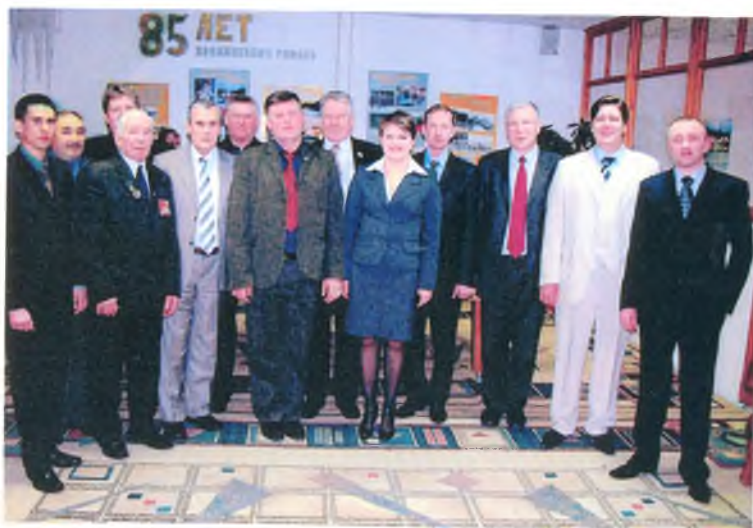
Делегация гп Луговой в РКЦИ «Конда» на праздновании 85 – летия Кондинского района