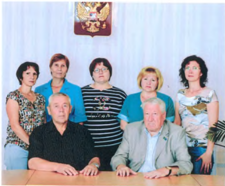
Коллектив Администрации и АХС гп Луговой в здании по ул. Пушкина, 7 в зале заседаний. Лето 2015 г.