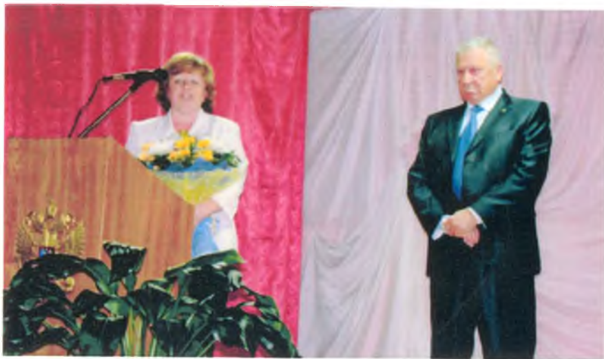
Инаугурация главы гп Луговой. Сентябрь 2013 г.