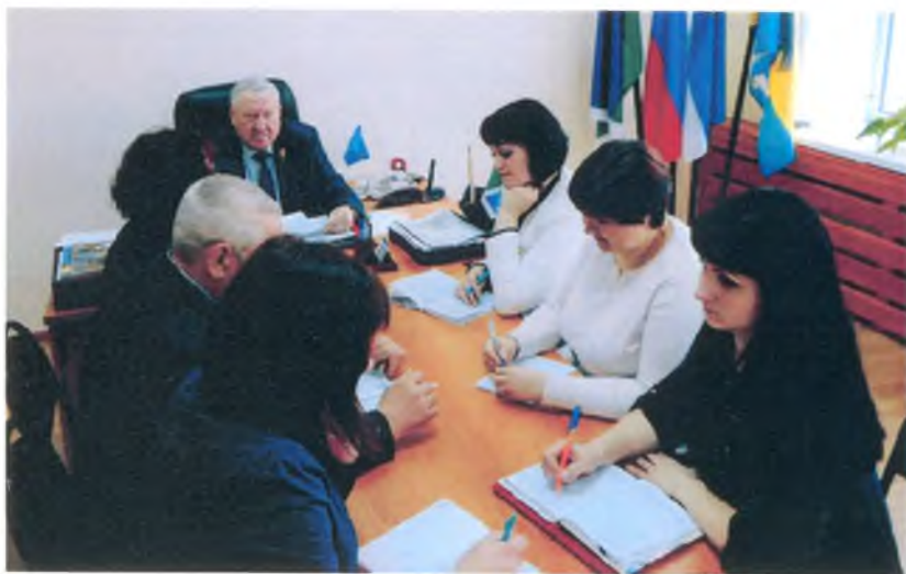
Аппаратная при главе с руководителями и специалистами Администрации. 2016 г.