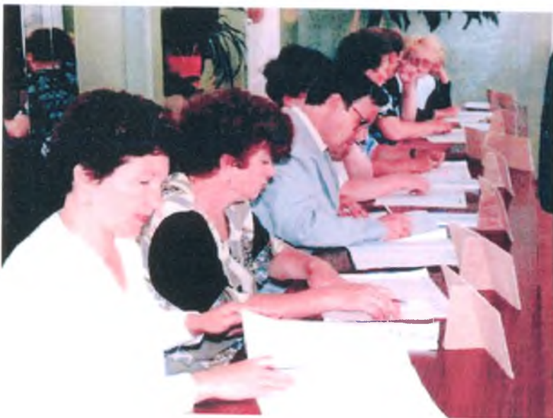
Участковая избирательная комиссия Луговского пос. Совета на избирательном участке. 1989 г.