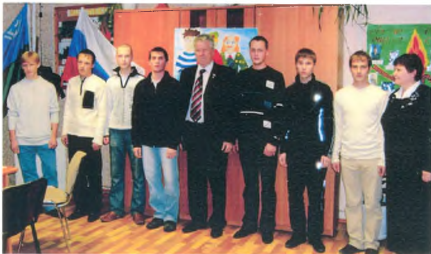
Проводы в армию юношей нашего поселения. 2008 г.