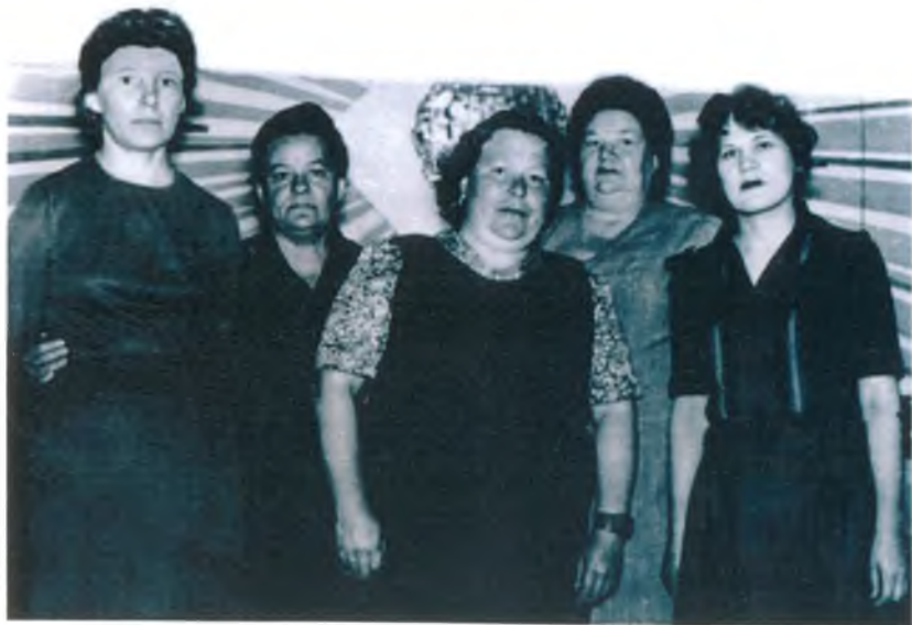
Коллектив Луговского поселкового Совета. 1984 г.