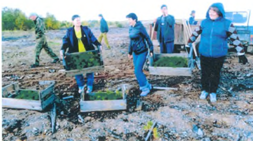
Коллектив Администрации и АХС гп Луговой на посадке саженцев. Май 2017 г.