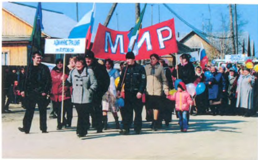
Администрация гп Луговой в праздничной колонне. 1 мая День Весны и Труда