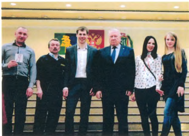
Встреча с чемпионом мира по лыжным гонкам, нашим земляком Сергеем Устюговым. Март 2017 г.