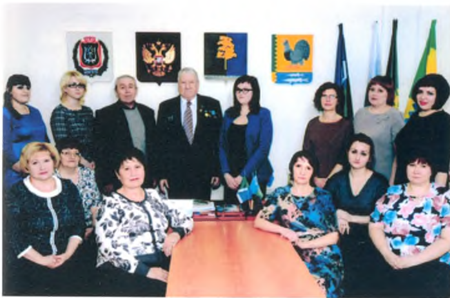
Коллектив Администрации и АХС в рабочем кабинете главы гп Луговой. Январь 2017 г.